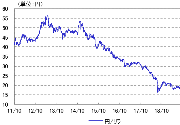
トルコ・リラ 為替レート 2011/10/14~2019/09/30