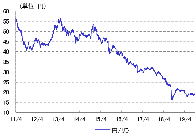
トルコ・リラ 為替レート 2011/04/01～2019/09/30