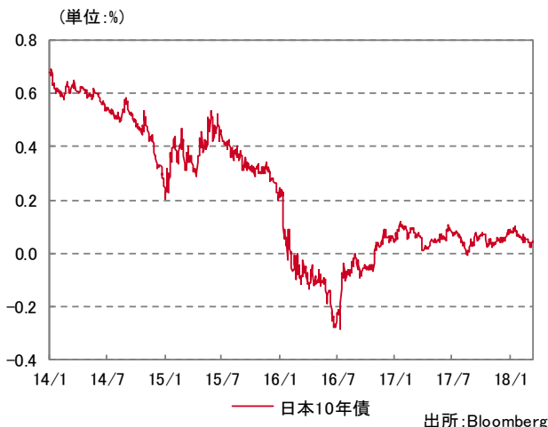
日本国債の利回り推移 2014/01/16～2018/03/30