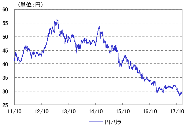
トルコ・リラ 為替レート 2011/10/14~2017/12/29