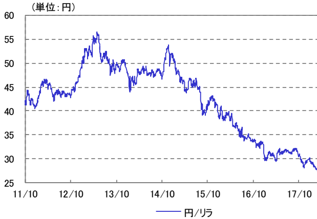
トルコ・リラ 為替レート 2011/10/14~2018/03/30