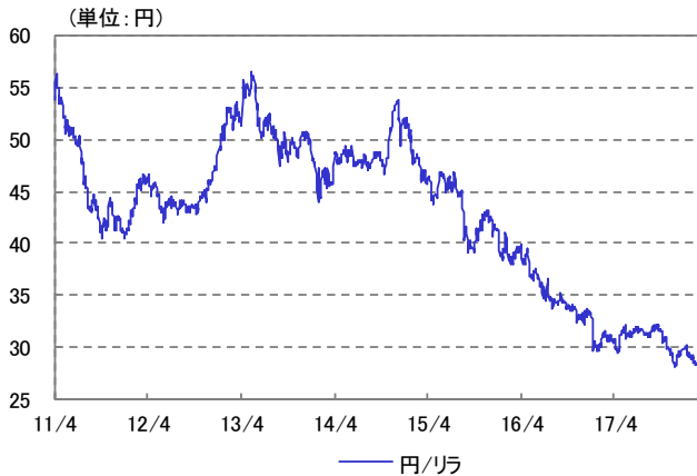
トルコ・リラ 為替レート 2011/04/01～2018/02/28