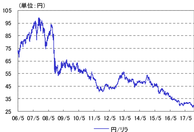
トルコ・リラ 為替レート 2006/05/31~2017/12/29